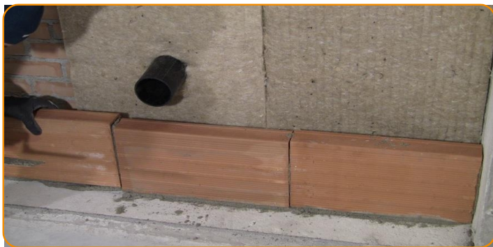
Sākat sienas izbūvi