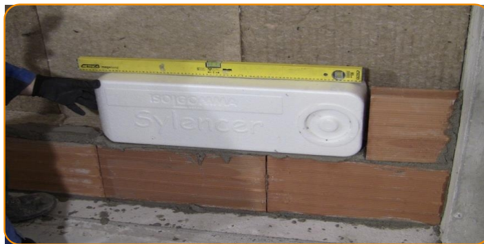
Montējat Sylencer uz mūrjavas