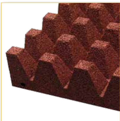
Speciale struttura sagomata (raster) per un alto HIC Special shaped structure (raster) for a high HIC

Megasafe tiles are available in 1x1 m or 0,5x0,5 m width; they are ready for pins connections with 4 holes on the two opposite sides which allow a staggered laying procedure.