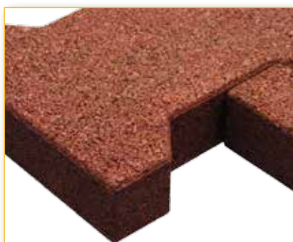
Piastra in versione interlocking di dimensioni 200x165x43 mm Interlocking tile version with dimensions 200x165x43 mm