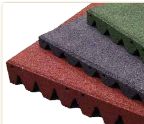
Colorazioni standard disponibili Standard coloring available