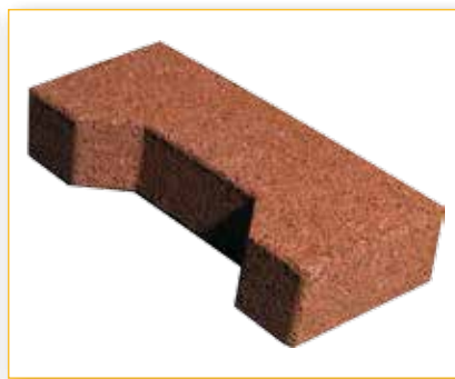
Versione Interlocking cut per bordature Interlocking cut version for border finishings