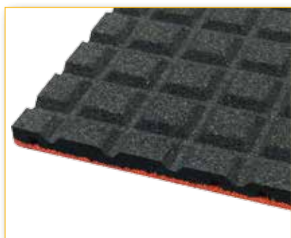
Speciale struttura sagomata (raster) Special shaped structure (raster)

The Megasport line also includes an interlocking tile version with a thickness of 43 mm which helps cover even complex areas and corridors with high-wear surfaces.