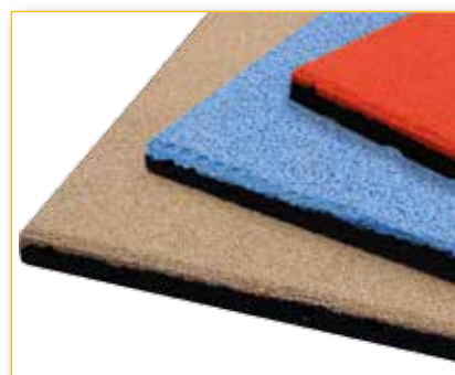
Finitura con colori su richiesta in EPDM Finishing in colors upon special request in EPDM