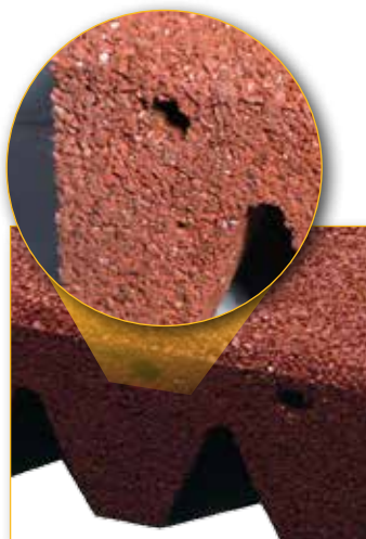
Foro predisposto per la connessione con spinotto Hole for a connector with plug