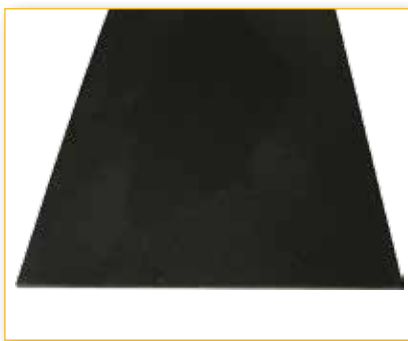
Materassino impermeabile per aree di lavaggio o cura Impermeable mats for washing or animal care